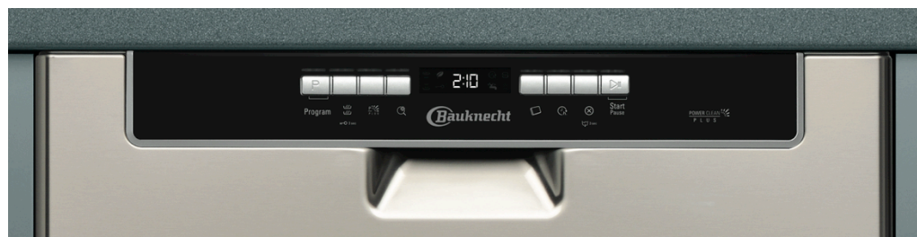
Acht Spülgänge plus Zusatzfunktionen – der GSU 81454 A++ PTU ist intuitiv bedienbar