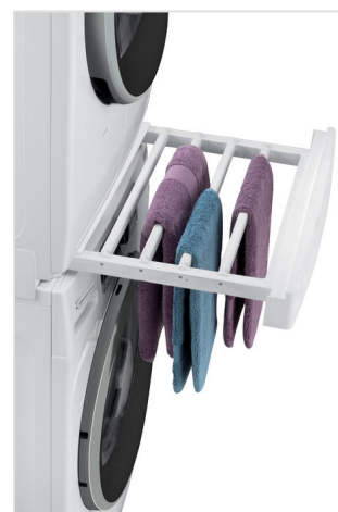
Stabil gestapelt: Der Verbindungsrahmen ist gleichzeitig wahlweise Ablage oder Trockengitter

In Sachen Design entfaltet die Waschmaschine ihre volle Stärke im Zusammenspiel mit dem PremiumCare Trockner. Die Geräte sind optisch aufeinander abgestimmt – sie stehen auf derselben Plattform und ergänzen sich perfekt: Nebeneinander platziert öffnen die Türen gegenläufig. Fehlt der Platz, lassen sich die Geräte mit dem soliden Verbindungsrahmen auch aufeinander stellen – kinderleicht und ohne zu bohren. Der mit speziellen Klammern an der Rückseite von Waschmaschine und Trockner befestigte Rahmen bietet zwei weitere sinnvolle Funktionen: eine zusätzliche Ablagefläche oder ein Trockengestell für Kleidung. Der Rahmen ist erhältlich über Bauknecht.de und den einschlägigen Fachhandel.