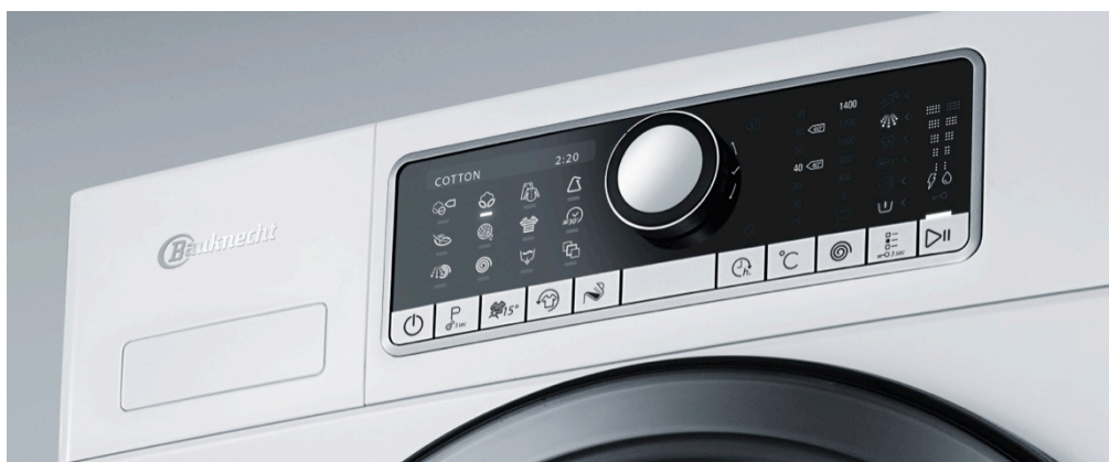
Intuitiv verständlich: Zentrales Bedienfeld mit Dreh-Drück-Schalter

den geringsten Wasserverbrauch auf dem Markt 4 – das schont die Haushaltskasse und die Umwelt.