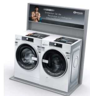
State of the art: PremiumCare am Point of Sale

Am Point of Sale präsentiert Bauknecht die PremiumCare Reihe auf der Höhe der Zeit und setzt die Stärken der neuen Geräte effektiv in Szene: Auf einen Blick erfährt der Kunde von den PremiumCare Vorteilen. Hochwertige Displays mit beleuchtetem Sockel und dem PremiumCare Video auf einem breitformatigen Bildschirm werden zum Blickfang für jede Verkaufsfläche. Ergänzende Salesfolder erklären sämtliche Features einfach und eingängig und zeigen die verschiedenen Baureihen von PremiumCare.