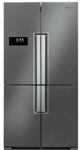
Optimal zu Beladen: Der NoFrost Side by Side von Bauknecht mit vier gegenläufig öffnenden Türen

Für die Anforderungen in Einbauküchen hat Bauknecht ebenfalls innovative Kühl-/Gefrier-Kombinationen im Angebot. Die neuen Geräte sind innen größer geworden und passen doch in die standardisierten Nischen von 160, 180 und 190 Zentimetern. Die ProFresh-Technologie optimiert das Innenraum-Klima des Kühlschranks und hält Temperatur und Luftfeuchtigkeit stets auf Idealbedingungen. So halten sich Lebensmittel bis zu vier Mal