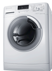
Bauknecht Ultimate Care Waschmaschine

Waschmaschinen werden nicht nur an ihrer Reinigungsleistung gemessen, sondern vor allem auch daran, wie sanft sie mit der Wäsche umgehen. Die neue Bauknecht Waschmaschine erhält Form, Textur und brillante Farben aller Textilien. Möglich wird dies durch das Trommeldesign der UltimateCare Schontrommel, das die Wäsche auf 1500 Mikro-Wasserkissen bettet und durch sanfte Wäscheheber besonders reibungsarm bewegt, sowie durch die innovative Softmove Technologie. Diese passt die super-sanften SoftMove Trommelbewegungen optimal der Ladung an und bewahrt damit auch empfindliche Kleidungsstücke vor Faserschäden und Verblassen. Dabei erzielt die UltimateCare Waschmaschine im 15°C Green&Clean Programm dieselbe Waschleistung wie bei 40°C – so bleiben brillante Farben länger frisch. Mit Stromeinsparungen von bis zu 60 Prozent 2 und dem niedrigsten Wasserverbrauch auf dem Markt 4 schützt die A+++ -30 Prozent Waschmaschine nicht nur Textilien, sondern auch Umwelt und Geldbeutel.