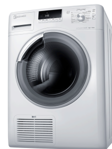
Bauknecht UltimateCare Trockner

1 Tests durchgeführt von TÜV-Rheinland; die UltimateCare Waschmaschine absolvierte 2500 Waschzyklen (Test ID 0000033599), der UltimateCare Trockner 1800 Trocknerzyklen (Test ID 0000037912). Dies entspricht jeweils einer Lebenszeit von mindestens zehn Jahren.