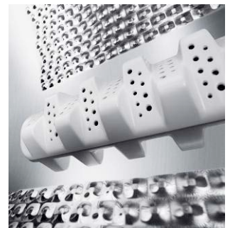
Detailansicht der UltimateCare Schontrummel