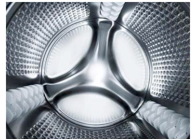
Die UltimateCare Schontrummel bettet die Ladung beim Waschen auf 1500 Mikro-Wasserkissen und schützt Fasern und brillante Farben