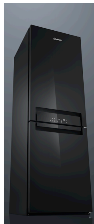
Starker Auftritt auf der IFA: Ultimate NoFrost mit Connectivity

Die Innenraumbeleuchtung sorgt für eine absolut gleichmäßige Lichtverteilung – LEDs leuchten nicht nur von oben, sondern auch von den Seiten und der Rückwand des Kühlschranks. Dieses sogenannte „Theatre Light“ schafft den optimalen Überblick, auch wenn der Kühlschrank voll beladen ist. LEDs brauchen zudem deutlich weniger Strom als herkömmliche Glühbirnen, erzeugen keine Wärme und halten bis zu zehn Mal länger.