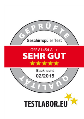
Bauknecht Geschirrspüler GSF 81454 A++ PT