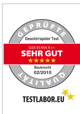
Bauknecht Geschirrspüler GSX 81454 A++