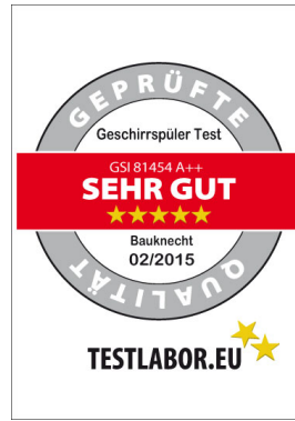
Bauknecht Geschirrspüler GSI 81454 A++ PT