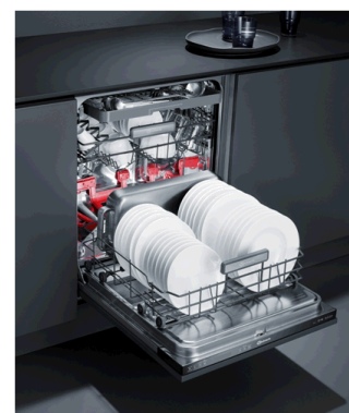
Vorspülen und Nachtrocknen überflüssig: Geschirrspüler mit PowerDry