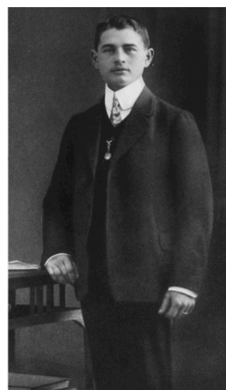
Erfinder Gottlob Bauknecht legte 1919 den Grundstein für die Marke Bauknecht

Auch wenn er heute inhaltlich überholt ist: Mit dem damaligen Slogan „Bauknecht weiß, was Frauen wünschen“ trifft die Marke genau den Zeitgeist der Wirtschaftswunderzeit und bringt den Mehrwert der Bauknecht Geräte auf den Punkt. Deutschland erholt sich schnell und elektrische Haushaltshelfer sind für die Menschen ein Zeichen des Wohlstands.