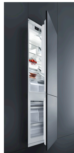
Kühlen und Gefrieren im Jahr 2014: Die neuen Einbaugeräte von Bauknecht