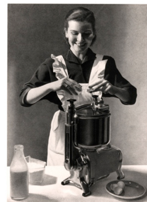
1947 wird der Fleischwolf KMW eingeführt.