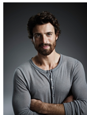
Seit 2013 das Gesicht der Marke: Mr. Bauknecht

Mit den UltimateCare Geräten setzt Bauknecht heute neue Maßstäbe in puncto Wäschepflege, denn Waschmaschine und Trockner schonen Farbe und Form ihrer Wäsche. So sehen besonders pflegebedürftige Lieblingsstücke, wie edle Wollpullover und einzigartige Designerstücke, nach vielen Wäschen und Trockenvorgängen noch aus wie neu. Die wegweisenden Geräte begeistern auch mit TÜV-zertifizierter Langlebigkeit von mindestens zehn Jahren 1 und Energieeinsparungen von bis zu 60 Prozent 2 .