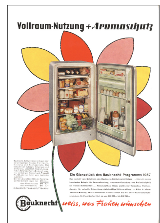
Werbung für Kühlgeräte in den 1950ern

Heute steht Bauknecht mehr denn je für die Werte seines Gründers: Das Unternehmen zeichnet sich durch ein feines Gespür für die aktuellen und zukünftigen Bedürfnisse der Kunden aus und bietet dabei „Mehr als Technik“.