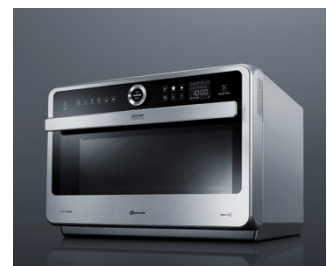
37 Jahre liegen zwischen der ersten Bauknecht Mikrowelle von 1977 und dem JetChef von 2014