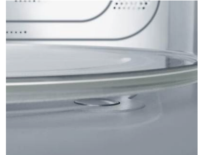
Der neue Gewichtssensor ermöglicht punktgenaue Garung

September 2013: Kulinarische Genüsse wie zartes Lammkarree, selbstgebackene Pizza oder frischer Spargel fallen im Alltag oft Zeitmangel und Stress zum Opfer. 60%* der Deutschen wünschen sich daher Geräte, mit denen zum Beispiel Kochen besser und leichter von der Hand geht. Diesen Komfort schenkt die neue JetCuisine Mikrowelle: Sie ermöglicht zusätzlich zur Mikrowellenfunktion auch die schonende und schnelle Zubereitung mit Dampf. Mit der patentierten Crispfunktion lässt sich knusprig backen, während die zuschaltbare Heißluftfunktion Garen viel schneller als bei traditionellen Kochmethoden ermöglicht – mit dem neuen Gewichtssensor gelingt dabei jedes Gericht auf den Punkt. Mit JetCuisine findet sich auch im anspruchsvollsten Alltag Zeit für gesunde Gaumenfreuden.