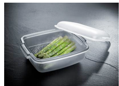
Dampfgarbehälter der JetCuisine Mikrowelle

Bauknecht Mikrowellen können weit mehr als „nur“ auftauen und erwärmen: Sie sind kompakte Multitalente mit einem breiten Leistungsspektrum, die Platz in der Küche und Zeit beim Kochen sparen. „Mit der neuen JetCuisine können Konsumenten im Handumdrehen köstliche, gesunde Gerichte zaubern. Ob grillen, überbacken oder schonend im Dampf garen – die