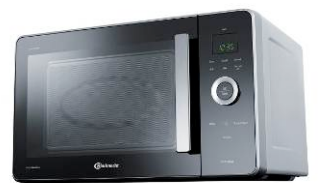
JetCuisine ist mit schwarzem und silberfarbigem Rahmen erhältlich

Mit dem Gewichtssensor in der neuen JetCuisine wird punktgenaues Garen zum Kinderspiel. Der Nutzer muss nur auswählen, was sich in der Mikrowelle befindet und das Gerät übernimmt automatisch alle anderen Einstellungen – noch nie war Kochen so einfach und so lecker. Egal ob gegrillt, knusprig überbacken oder schonend im speziellen Dampfgarbehälter zubereitet, mit JetCuisine wird jedes Gericht einfach köstlich. Auch die perfekte Balance zwischen Kochen, Aufgehenlassen und Überbacken gelingt dank der einzigartigen Crisp Funktion. Selbst gefrorenes Brot wird mit der neuen Crisp Brotauftaufunktion knusprig wie frisch vom Bäcker. In unserem immer schneller werdenden Leben wird Zeit die wichtigste Ressource – und JetCuisine damit zum unersetzlichen Helfer in der modernen Küche. Die hochwertige Mikrowelle setzt dabei auch mit ihrer schlichten Eleganz optisch ein Highlight.