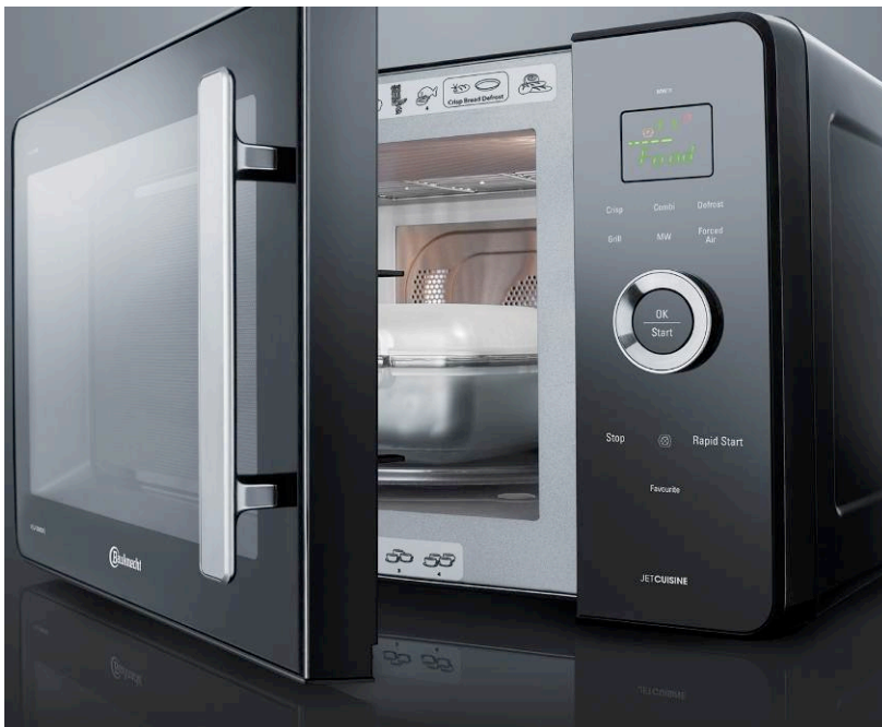
Bauknecht JetCuisine Mikrowelle mit Dampfgarbehälter